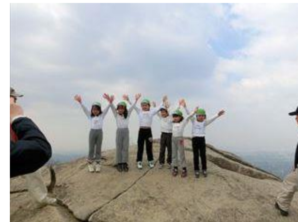
交野山山頂 観音岩 大阪府交野市倉治

私たちは、交野山森林公園で、かつての里山を取り戻し、多くの動植物を育んでいく。そんな持続可能な森づくりに取り組んでいます。