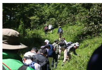
8/2 経団連自然保護協議会