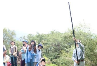
ゼフィルス観察会のようす