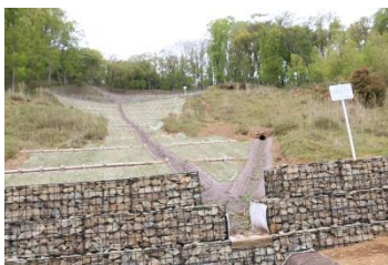
工事後の山腹崩壊地

2 年に渡って実施された大阪府による工事は、2 月に終了した。大阪公立大学によるモニタリングを実施し、植生再生方法検討については、当面遷移を把握するためのモニタリングを継続することになった。また、アメリカオニアザミやダンドボロギク等の外来植物の進入が確認されたため、8/20、9/3 のボランティア定例活動時に駆除を行った。