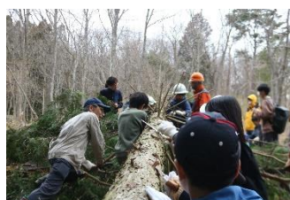
3/17 エネフリ Smile