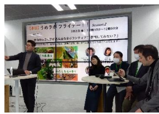
2/2 うめラボフライデー