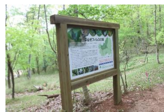
外枠を交換した解説板