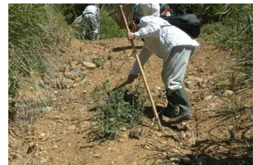
8/20、9/3 アメリカオニアザミ駆除