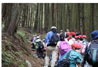
6/13 ささゆり学園環境教育

②エネクスフリー株式会社が大阪府内の児童養護施設の子どもたちに里山体験をプレゼントする社会貢献活動「エネフリ Smile」を実施 (11/19、3/17) する際に、針葉樹の伐倒体験やクラフトづくりのプログラムを実施した