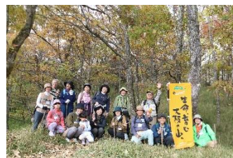
ハイキングのようす