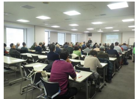
大阪さとり地域協議会セミナー

2025年度より、同事業は「里山林活性化による多面的機能発揮対策交付金事業」として再スタートする。引き続き、適正で円滑な事業の推進に加え、安全講習会やセミナー・交流会の開催、アドバイザーの派遣など、活動組織の持続可能な活動に向けた取り組みの充実を図る。