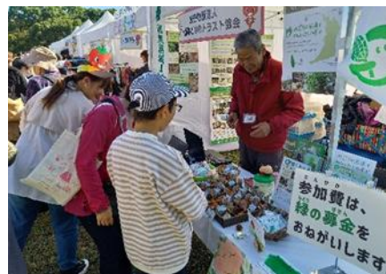
コープフェスタへの出展

イベント等の情報発信として、大阪府から配信するホームページ「まいのち」(2025年4月から公開)や、「おおさか生物多様性応援宣言団体」のメーリングリストを活用する。