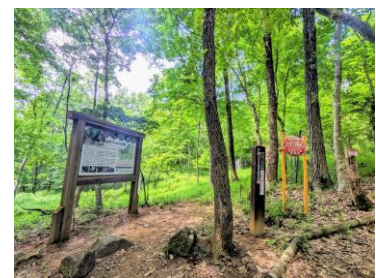
三草山ゼフィルスの森