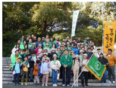
緑の少年団 交流集会

大阪府内の緑の少年団に対して活動助成を行うとともに、「子どもたちが緑や自然に触れ、森林や緑化に関する意識を高める」という目的に沿った連盟の運営・交流行事の開催が行われるよう、各団の自立を促しつつ大阪府緑の少年団連盟事務局として支援する。