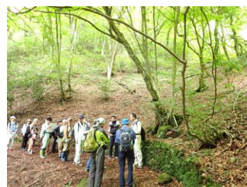
和泉葛城山ブナ林