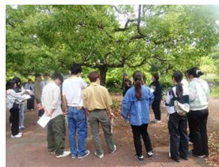
教育大学学生向け講習

大阪教育大学、大阪森林インストラクター会等と連携し、教育大学学生を対象に森林ESDを体験する講習を実施する。