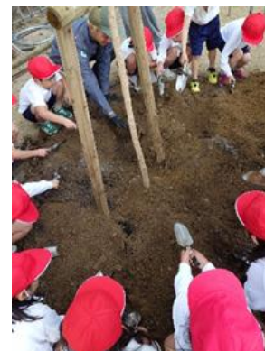
みどりづくりの輪活動

次世代を担う子どもたちが生物多様性や森林整備、木材の利用等について理解を深める機会となる活動の促進を図ることを目的に、子どもたちの参加による自然環境保全活動や緑化活動、森林整備活動、森林に関する学習等に助成する。また、これらの活動組立てや整備計画立案にあたり、専門家による助言を得られるよう、専門家の紹介や相談時の費用助成等の支援を行う。