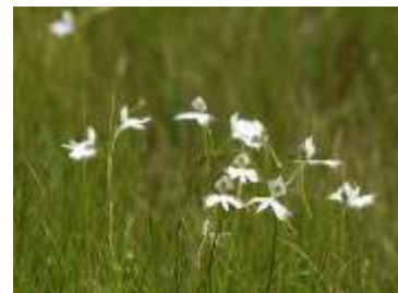
湿地内のサギソウ

7/27の定例活動日にサギソウの生育状況を記録した。 462個体以上を確認した。