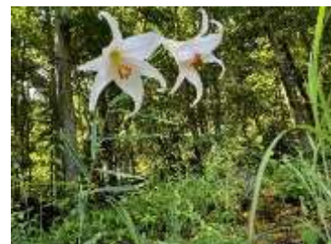
防鹿柵内のササユリ

残したいササユリなどの植物に印をし、それ以外の植物について植生管理のための草刈を実施した。