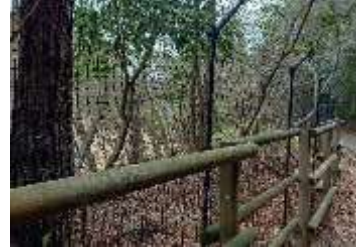
【下池町道沿】木柵を活用した柵