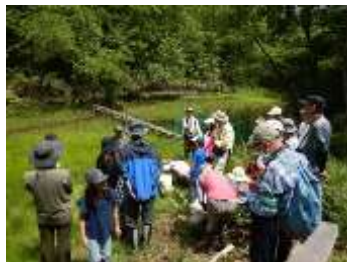
6/22 トキソウ・ハッチョウトンボ観察会