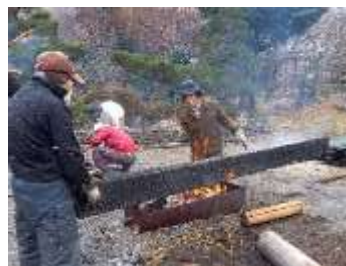
ボランティア活動による材の焼付

修復に使用した天板・梁・杭などの材は、ボランティア活動で焼き付けを行ったものを使用した。(別紙添付)