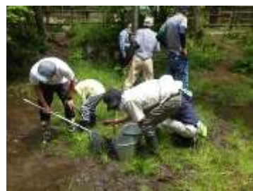
観察会でのメダカ駆除