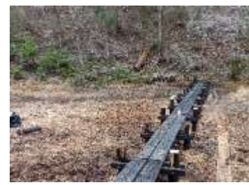
更新した木道(上池)