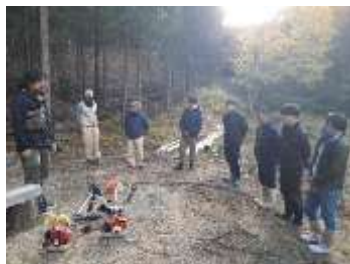
刈り払い前の打合せ

11 月～3 月の活動で、湿地内の枯れた植物体を刈り払い、撤去した。撤去については、今年度も畑に蒔く肥料などとして有効活用するため、能勢町内の農家の方に引き取っていただいた。