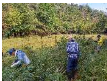
下池右岸袖部 防鹿柵内

2021 年度に設定したコドラートのうち、下池右岸の袖部で草地化を目指して刈払いを行った後に防鹿柵を設置した場所と、重機を用いて掘削を行った湿地内部分の追跡調査を 10/2 に実施した。（別紙添付）