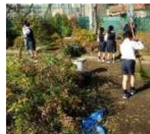
みどりづくりの輪活動

次世代を担う子どもたちが生物多様性や森林整備、木材の利用等について理解を深める機会となる活動の促進を図ることを目的に、子どもたちの参加による自然環境保全活動や緑化活動、森林整備活動、森林に関する学習等に助成する。また、これらの活動組立てや整備計画立案にあたり、専門家による助言を得られるよう、専門家の紹介や相談時の費用助成等の支援を行う。