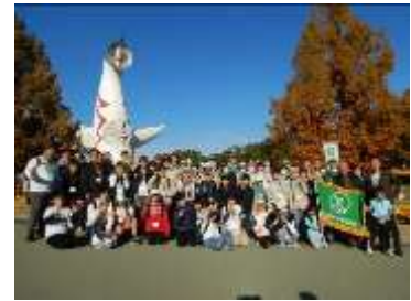
緑の少年団 交流集会

大阪府内の緑の少年団に対して活動助成を行うとともに、「子どもたちが緑や自然に触れ、森林や緑化に関する意識を高める」という目的に沿った連盟の運営・交流行事の開催が行われるよう、各団の自立を促しつつ大阪府緑の少年団連盟事務局として支援する。