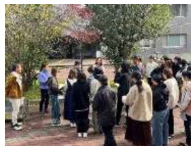
教育大学学生向け講習

大阪教育大学、大阪森林インストラクター会等と連携し、教育大学学生を対象に森林 ESD を体験する講習を実施する。