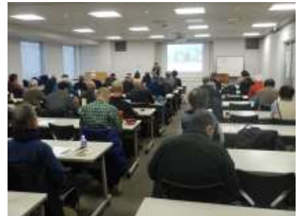
大阪さとり地域協議会セミナー

2025年度より、同事業は「里山林活性化による多面的機能発揮対策交付金事業」として再スタートしている。引き続き、適正で円滑な事業の推進に加え、安全講習会やセミナー・交流会の開催、アドバイザーの派遣など、活動組織の持続可能な活動に向けた取り組みの充実を図る。