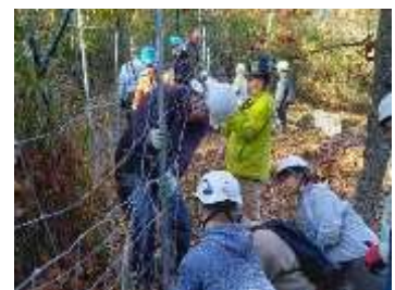
三草山ゼフィルスの森