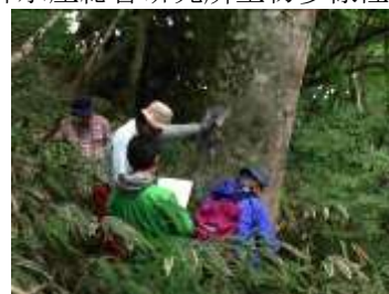
和泉葛城山ブナ林