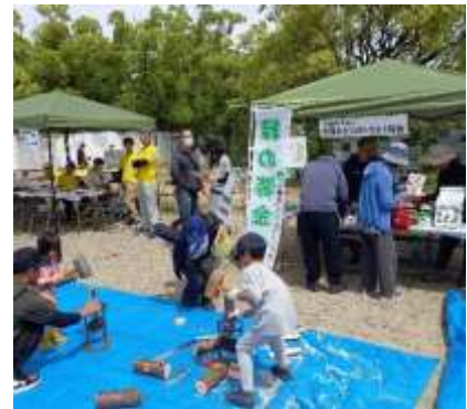
イベントブースへの出展

イベント等の情報発信として、大阪府から配信するホームページ「まいのち」や、「おおさか生物多様性応援宣言団体」のメーリングリストを活用する。