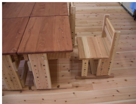
杉材利用による床の改修、机・椅子の整備